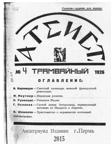
Рисунок 1 – обложки атеистических издательств «Атеист» и «Безбожник»

Назовите способы агитационной политики большевиков против Русской православной Церкви? Назовите цель проведения агитационной антицерковной политики?