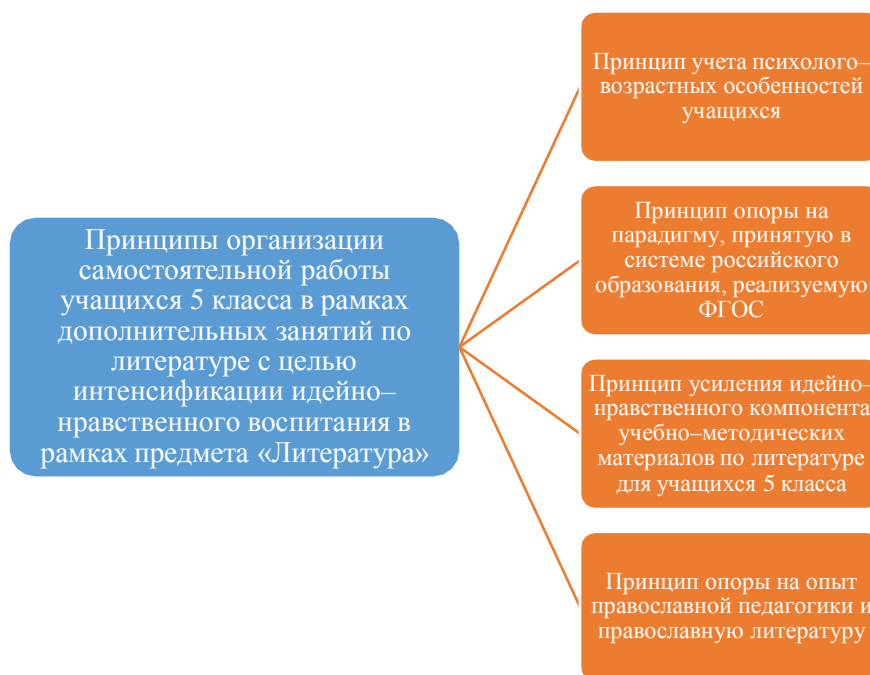
Схема 1- Принципы организации самостоятельной работы с целью интенсификации идейно-нравственного воспитания в рамках предмета «Литература»

Основные принципы основаны на достижениях отечественной и зарубежной педагогики в сфере возрастной психологии и педагогики. Их можно представить в следующей схеме 1: