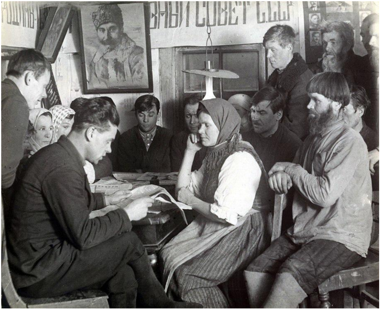
Изба-читальня, начало 20 века