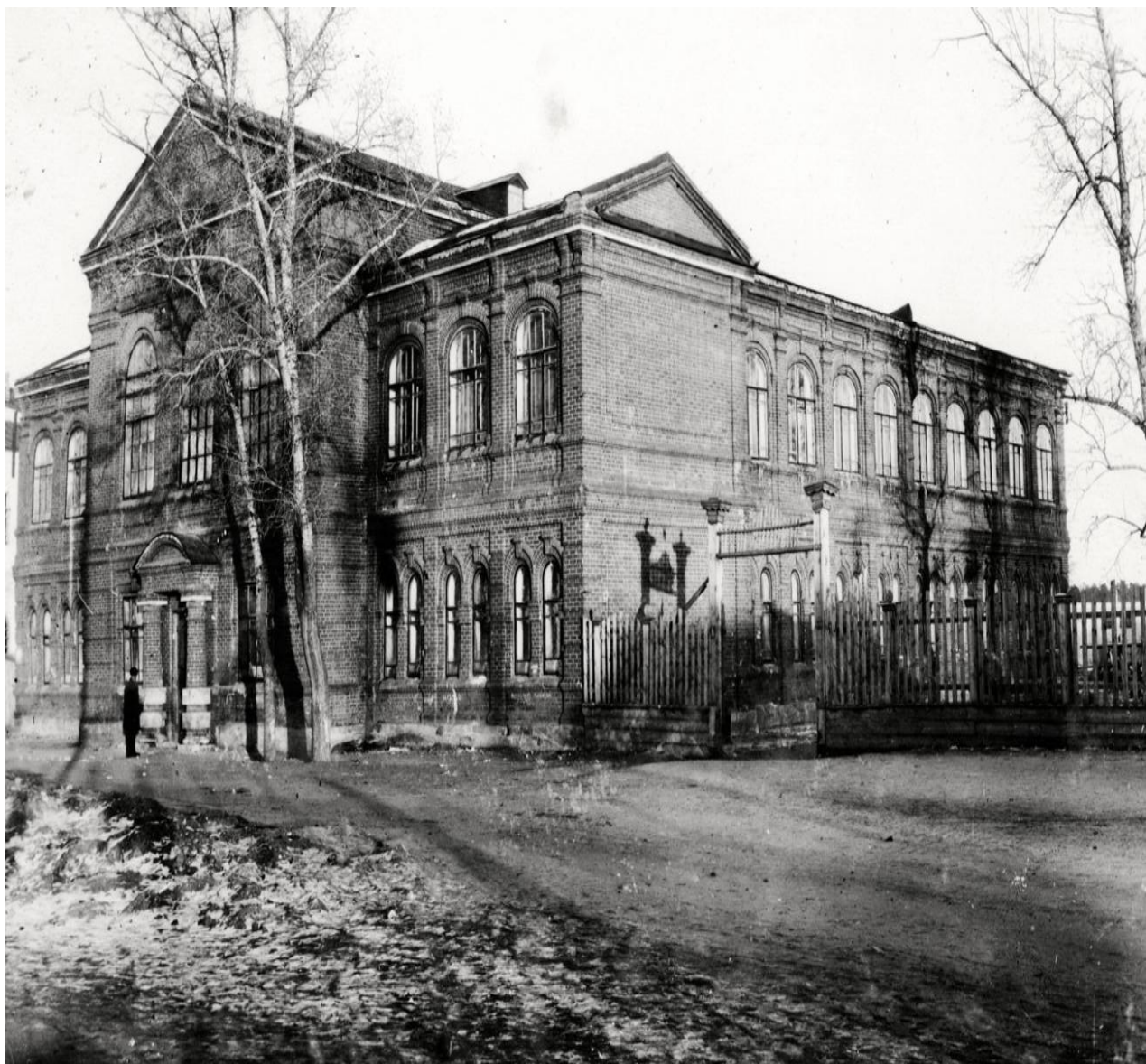
Школа № 1, г. Ставрополь-на-Волге, 1920 год