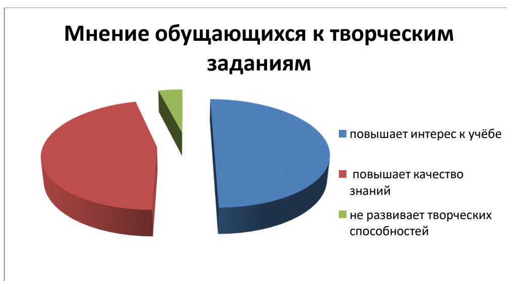
Рисунок 2 – Мнение обучающихся к творческим заданиям.

Изучив мнение обучающихся к заданиям творческого характера, выяснили, что многие из них считают, что умение мыслить творчески позволило бы им повысить качество знаний и по другим предметам – 46%, задания творческого характера - это не развивают никаких творческих способностей - 4%, 50% считают, что такие задания интересны и многогранны и дают прочные знания, а так же повышают интерес к учебе. На рисунке 2 представлены результаты учащихся.