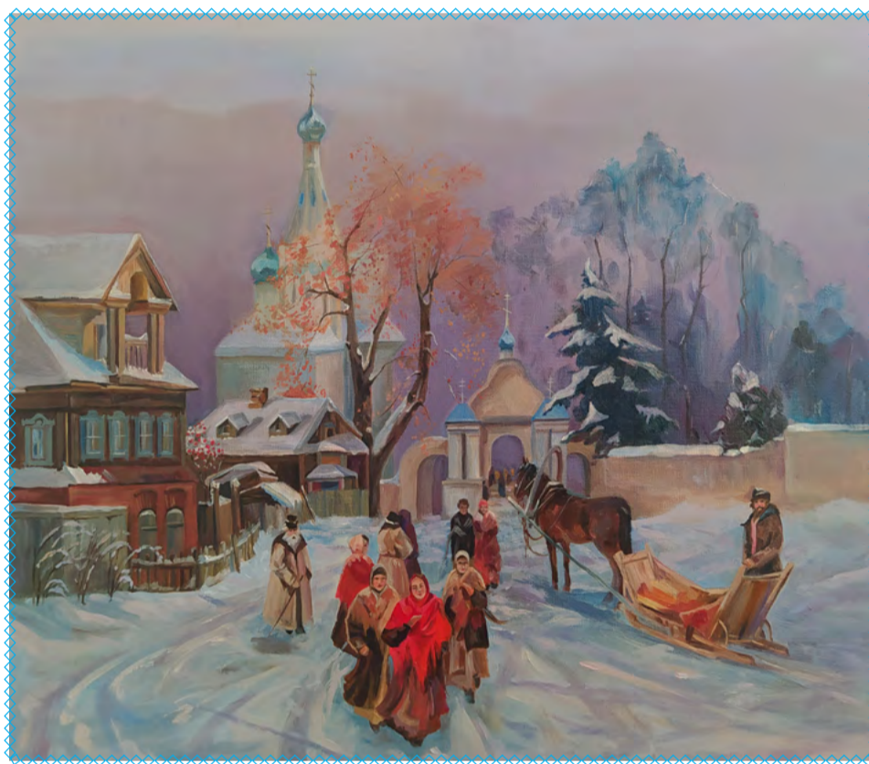
Рисунок студентки Гуманитарного колледжа Тольятти Анастасии Терпеловой

Мы прославляем сегодня родившегося по плоти в Вифлееме Господа, радуемся премудрости Бога, на-