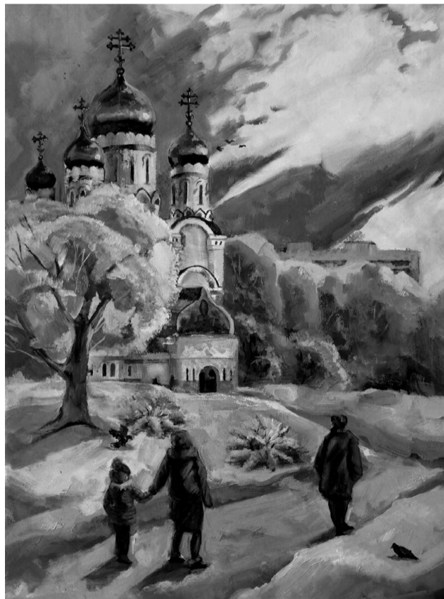
Рисунок Ладыгиной Дарьи «Рождественский день», Гуманитарный колледж

Небесный Отец, у Которого миллиарды духовных детей! Велика премудрость и божественная благодать Господни. Мы должны оценить, какую огромную любовь имеет Создатель к нам, и откликнуться на Его призыв: «Жаждающий пусть приходит, и жаждущий пусть берёт воду жизни даром» (Откр. 22, 17).