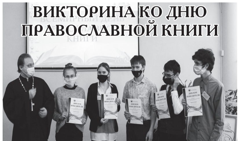
12 марта Молодежный отдел Тольяттинской епархии совместно с Центральной библиотекой имени В.Н. Татищева г. Тольятти в рамках празднования Дня православной книги провел викторину, посвященную 800-летию Александра Невского.