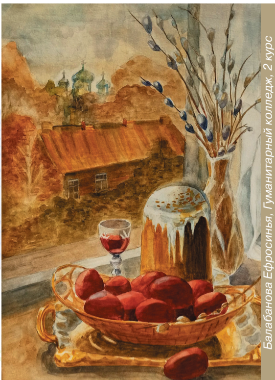
Балабанова Ефросинья, Гуманитарный колледж, 2 курс